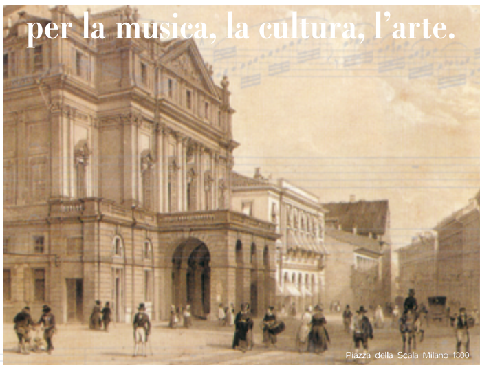
Piazza della Scala, Milano 1800.

La Fondazione Monte di Lombardia, che da sempre si impegna a promuovere progetti nell'ambito culturale, sostiene e incoraggia studenti e studentesse ad avvicinarsi al mondo della danza e dell'opera lirica.