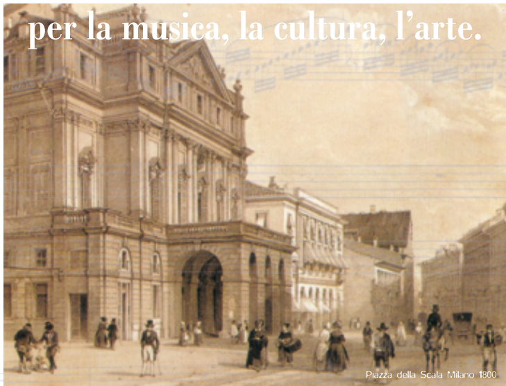
Piazza della Scala Milano 1900.

La Fondazione Monte di Lombardia, che da sempre si impegna a promuovere progetti nell'ambito culturale, sostiene e incoraggia studenti e studentesse ad avvicinarsi al mondo della danza e dell'opera lirica.