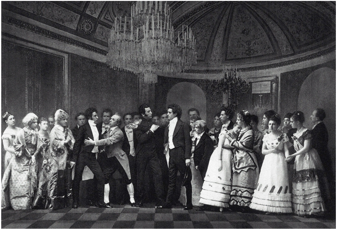
La prima rappresentazione di Evgenij Onegin al Teatro Malyj di Mosca del 17/29 marzo 1879. La scena della sfida a duello durante la festa nel II Atto.